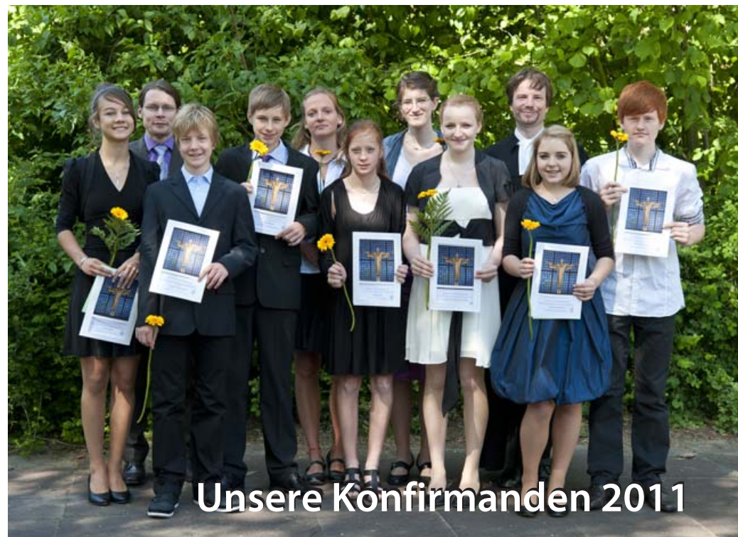
Unsere Konfirmanden 2011